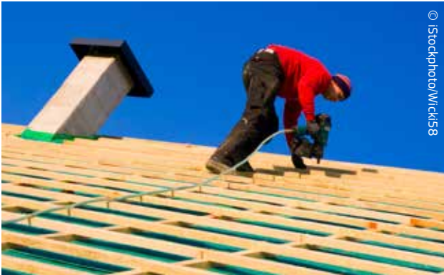
Padidinus namų energijos vartojimo efektyvumą taupomi pinigai ir tausojama aplinka.

Pagal ES reikalavimus šiltnamio efektą sukeliančių dujų kiekis, išmetamas per visą transporto priemonės skirtų degalų gyvavimo ciklą nuo gavybos iki paskirstymo, iki 2020 m. turi būti sumažintas 10 proc. Taip pat buvo pasiūlytos priemonės iki minimumo sumažinti biodegalų gamybos poveikį klimatui apribojant žemės ploto, kuris gali būti skirtas šiam tikslui, užuot skyrus jį žemės ūkiui ir miškininkystei, dydį.