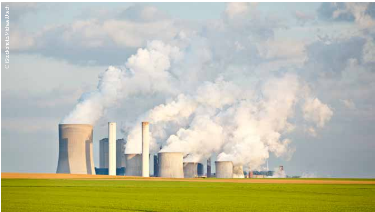
ES apyvartinių taršos leidimų prekybos sistema yra svarbi priemonė siekiant ekonomiškai efektyviai sumažinti išmetamų šiltnamio efektą sukeliančių dujų kiekį.

Šiose diskusijose dalyvauja aukščiausiojo lygmens politiniai vadovai. 2014 m. rugsėjo mėn. JT generalinio sekretoriaus Ban Ki Muno surengtame Valstybių vadovų aukščiausiojo lygio susitikime klimato kaitos klausimais apie 120 pasaulio valstybių vadovų pareiškė norą įsipareigoti dėti pasaulio mastu skubiai reikalingas pastangas. Gausiai dalyvavo įmonės ir platesnė pilietinė bendruomenė, o eisenoje „Žmonių klimatas“ Niujorko gatvėse dalyvavo apie 500 000 žmonių.