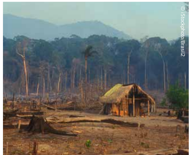
Klimato kaita spartėja dėl miškų naikinimo.

Be priemonių, kurių imamasi valstybėse narėse, ES padeda mažinti miškų naikinimo mastą besivystančiose šalyse. Ši finansinė parama papildo derybas pagal JT klimato kaitos konvenciją, vadinamą dėl miškų