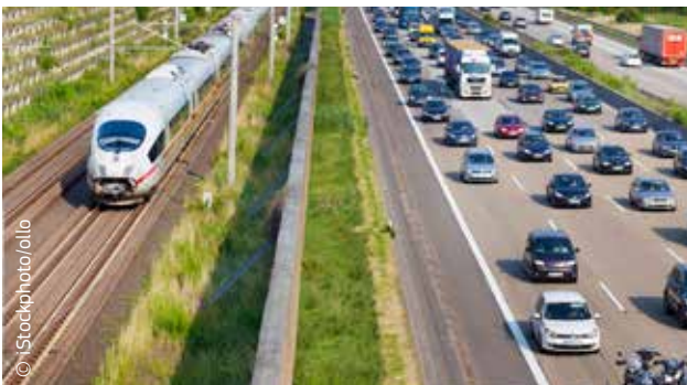
Transportas yra vienas iš pagrindinių šiltnamio efekta sukeliančių dujų šaltinių.

Šie rodikliai skirtingi – nuo išmetamų teršalų kiekio sumažinimo iki 2020 m. 20 proc. turtingiausiose ES valstybėse narėse iki išmetamų teršalų kiekio didėjimo 20 proc. skurdžiausiose valstybėse narėse. Šiais rodikliais siekiama, kad ES sektoriuose, kuriems netaikoma apyvartinių taršos leidimų prekybos sistema, bendras išmetamų teršalų kiekis iki 2020 m. būtų sumažintas 10 proc., palyginti su 2005 m. lygiu.